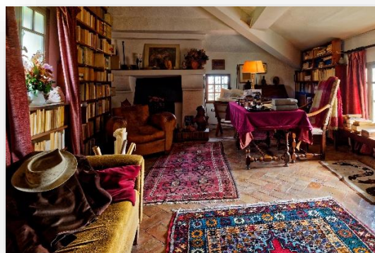
Bureau de Jean Giono

N'hésitez pas à nous contacter pour construire votre projet au 04 92 70 54 54 Le formulaire est à compléter et à envoyer de préférence par mail à centregiono@dlva.fr ou par courrier à Centre Giono 3 boulevard Elémir Bourges, 04100 Manosque Nous vous répondrons dans les meilleurs délais.