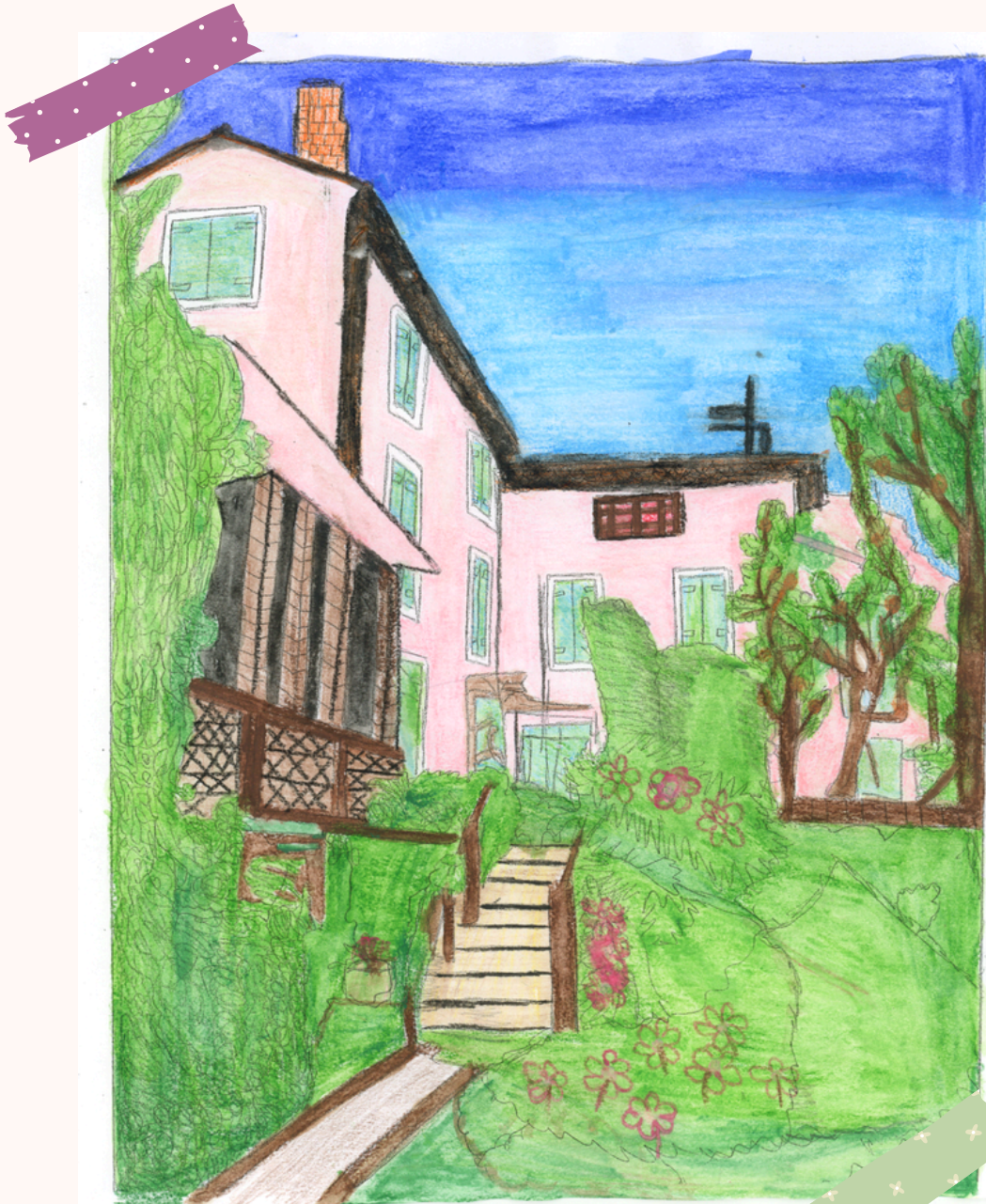
Dessin de Lina (stagiaire de 3ème) - Collège Jean Giono

Prendre rendez-vous au préalable avec la médiatrice afin de pouvoir, avant l'animation, bénéficier d'une présentation de la vie de Jean Giono en classe.