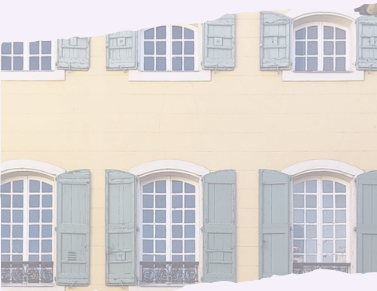
Couverture par Hélène Floquet (gravure du Centre culturel et littéraire Jean Giono).

Réservation nécessaire au 04.92.70.54.54 (jauge limitée).